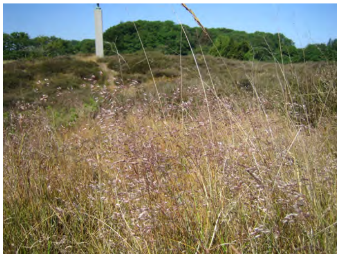
Bølget bunke på tør hede ved Tegnens Museumspark. Bølget bunke er konkurrerende art til lyngen.

Når afgræsning foregår uden eller med begrænset tilskuds fodring eller ved høslæt (dvs. med fjernelse af den afslåede biomasse), vil effekten være særlig positiv, idet plejen i disse tilfælde både sikrer lysåbne forhold og fjerner næringsstoffer fra arealerne.